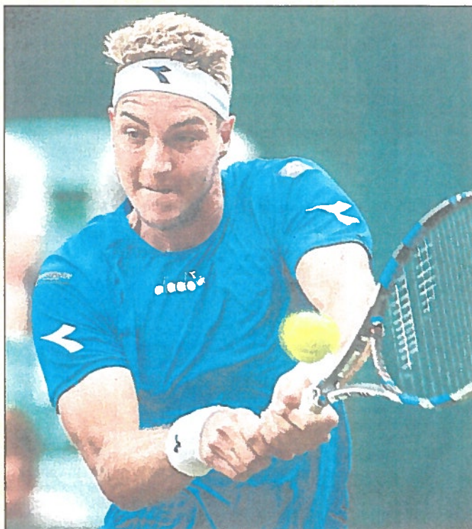
Der Einsatz von »Mister Bundesliga« Jan-Lennard Struff sorgt für Haller Zuversicht.

Der erste Spieltag auf einem Blick: RW Köln - BW Halle, BW Krefeld - Gladbacher HTC, BW Aachen - Kurhaus Aachen, Rochusclub Düsseldorf - TC Weinheim. GW Mannheim hat spielfrei.